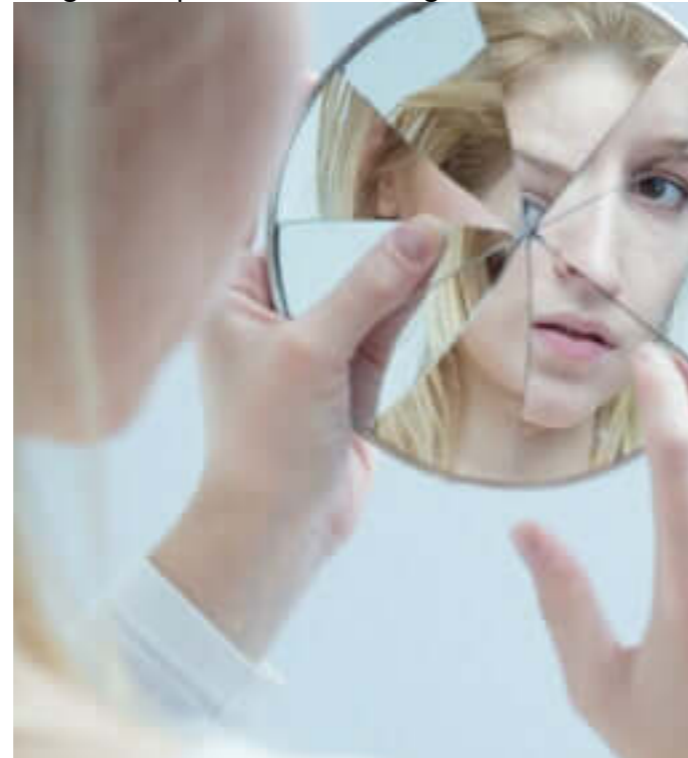
Imagen 1: representación desregulación emocional